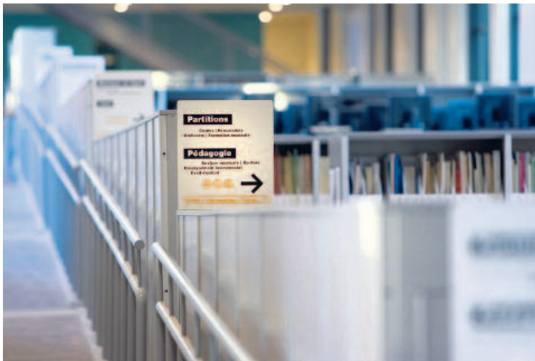
Les participants des JFREM 2005 ont pu bénéficier de visites commentées de la Cité de la Musique, notamment de sa nouvelle Médiathèque.